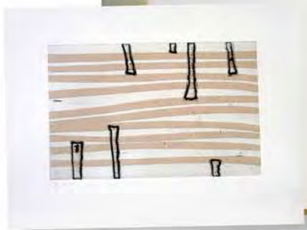
Figura 1. Vista de la obra de arte original de la artista en el momento de su creación y reproducción en el libro.