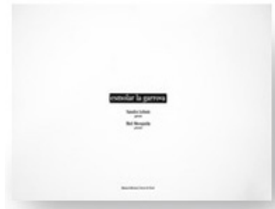
Gedichte in katalanischer Sprache...