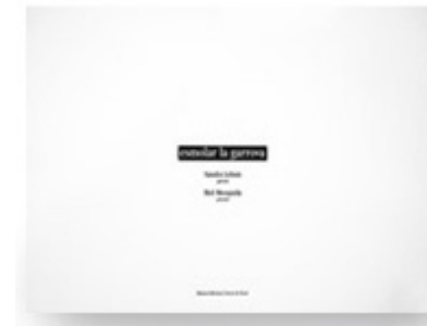
... und in französischer Übersetzung