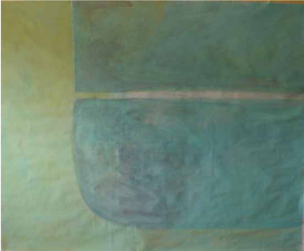
' Fenster in Genua ' Acryl auf Papier 150 x 180 cm Genua 2005