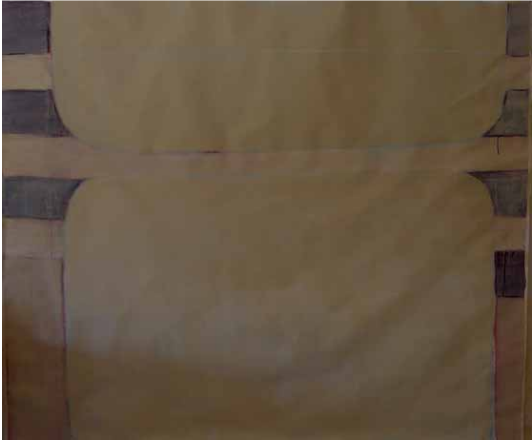
' Fenster in Genua ' Acryl auf Papier 150 x 180 cm Genua 2005