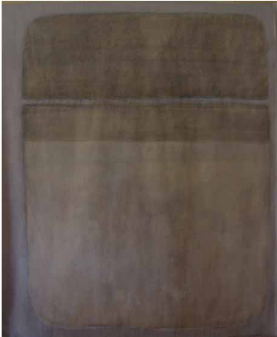
' Fenster in Genua ' Acryl auf Papier 180 x 150 cm Genua 2005