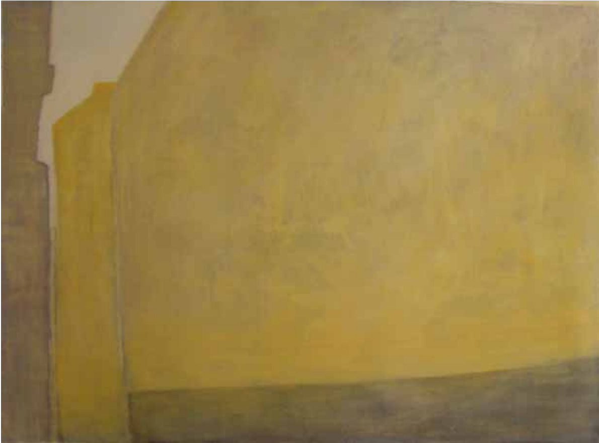
'Carruggi (Salita di S. Francesco) ', 2005 150 x 180 cm Acryl auf Papier Ankauf Kantons Solothurn