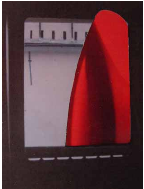
' Fenster in Genua ' Foto-Collage je 6 x 8 cm Genua 2005