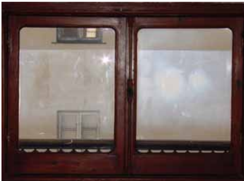
' Fenster in Genua ' Fotografie