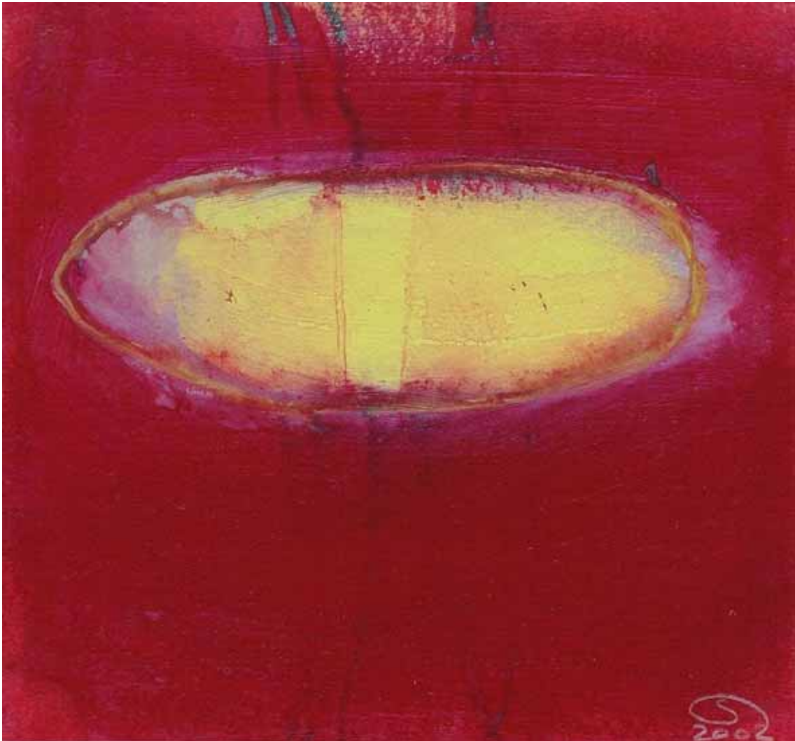
' Zauberstaub Nr. 4 ' Mischtechnik auf Papier auf Holz 17.8 x 16.5 cm 2002