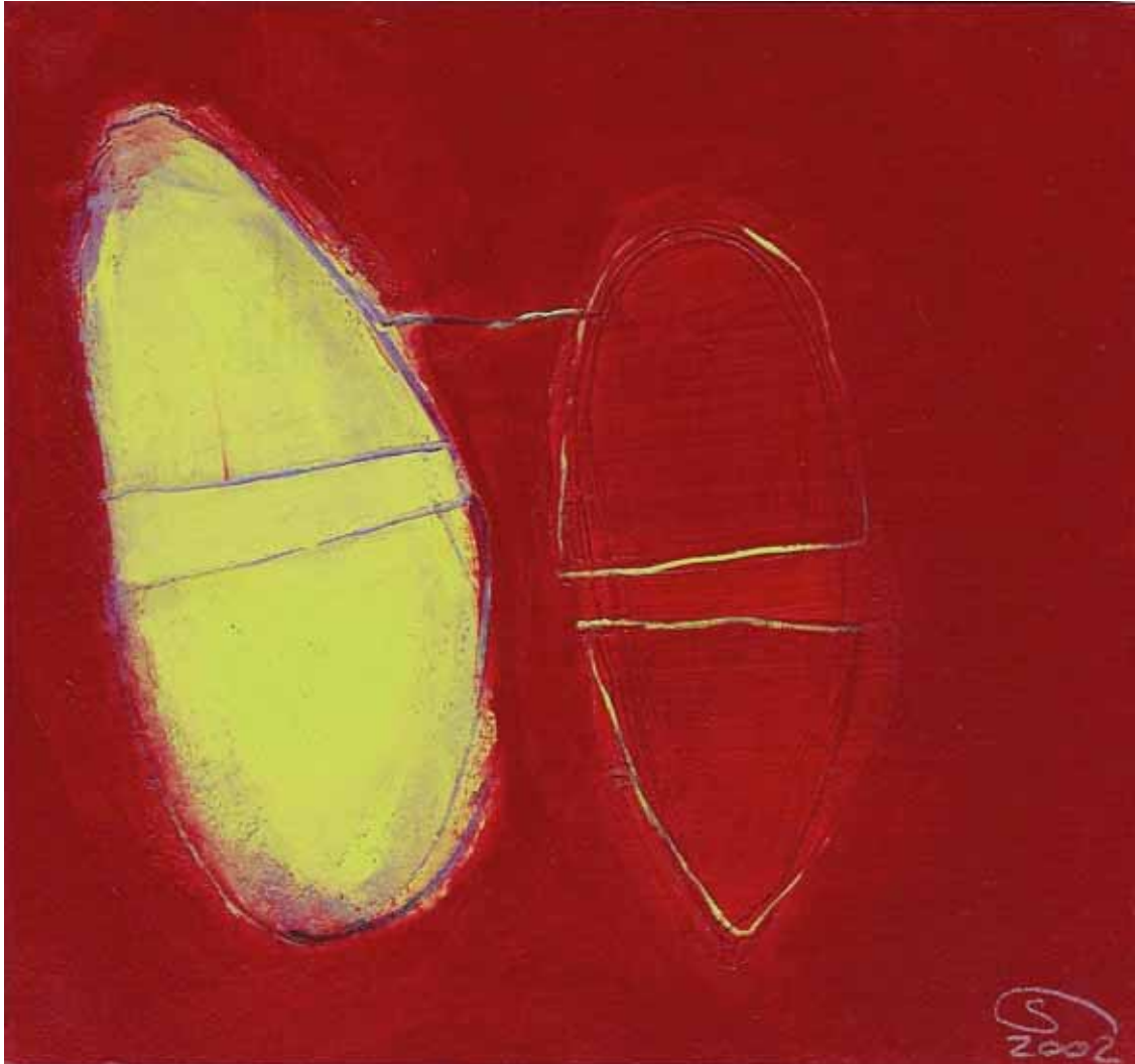
' Zauberstaub Nr. 12 ' Mischtechnik auf Papier auf Holz 17.8 x 16.5 cm 2002