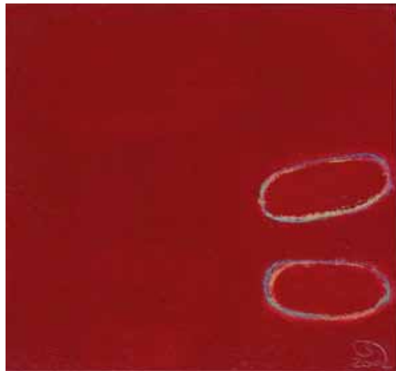
' Zauberstaub Nr. 14 ' ' Zauberstaub Nr. 16 ' ' Zauberstaub Nr. 17 ' ' Zauberstaub Nr. 20 ' Mischtechnik auf Papier auf Holz je 17.8 x 16.5 cm 2002