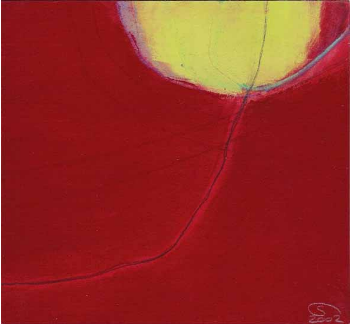
' Zauberstaub Nr. 5 ' Mischtechnik auf Papier auf Holz 17.8 x 16.5 cm 2002