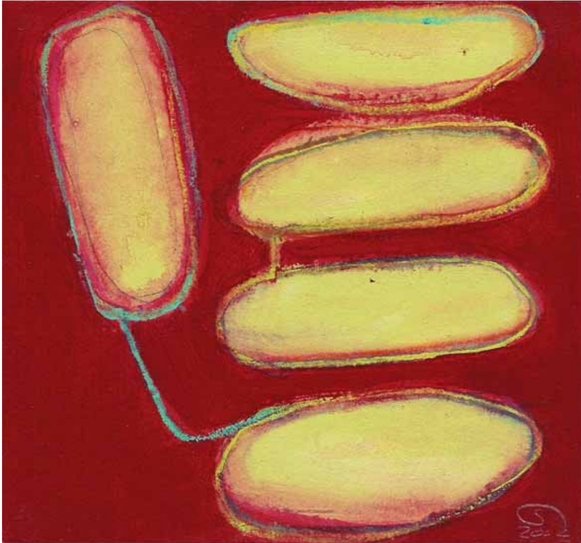
' Zauberstaub Nr. 22 ' Mischtechnik auf Papier auf Holz 17.8 x 16.5 cm 2002