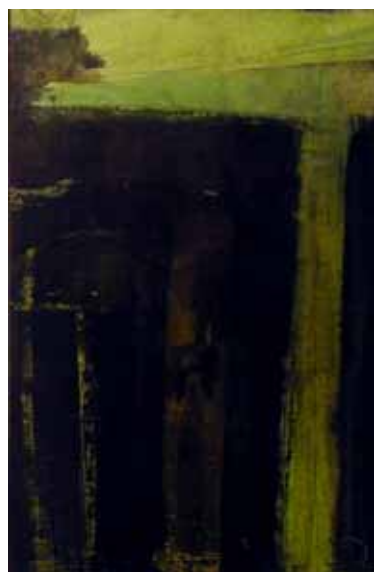
' growing ' Mischtechnik auf Papier auf Holz je 29.5 x 19.5 cm 2002